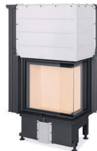
Impression R 2G L 58.60.34.21