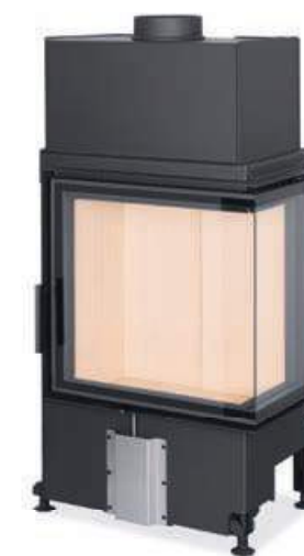
Impression R 2G S 58.60.34.21