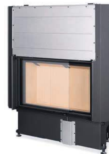
Impression 2G L 93.60.01