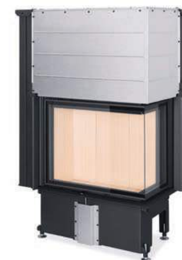
Impression R 2G L 71.60.34.21