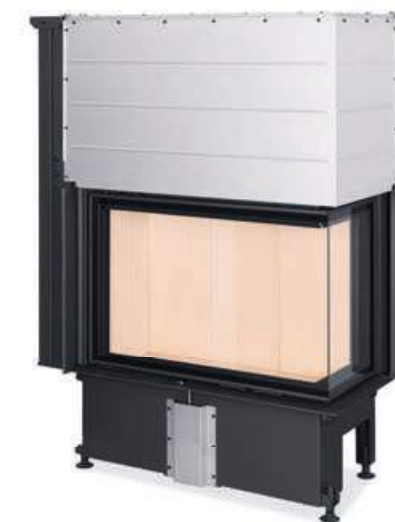
Impression R 2G L 83.60.34.21