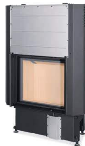
Impression 2G L 67.60.01