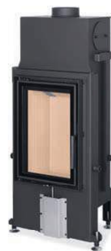
Impression 2G 42.60.01