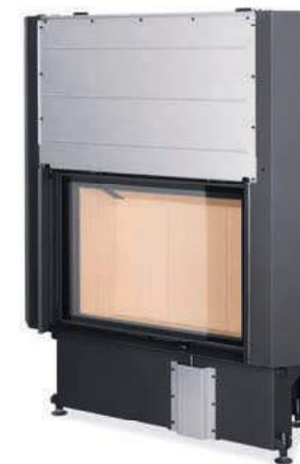
Impression 2G L 80.60.01