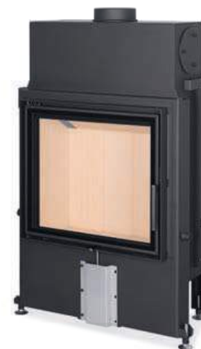
Impression 2G 67.60.01