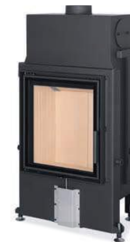
Impression 2G 55.60.01