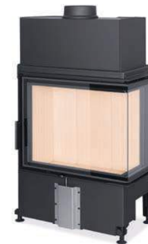
Impression R 2G L 71.60.34.21