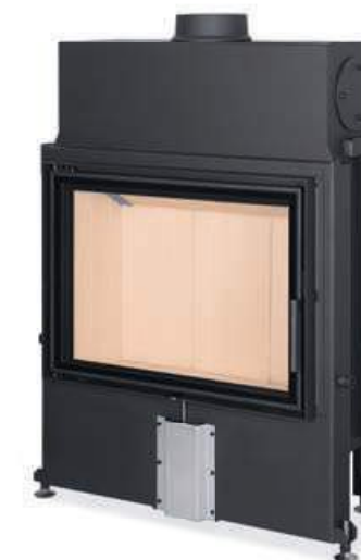
Impression 2G 80.60.01